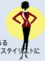
向上心のある パーソナルスタイリストに