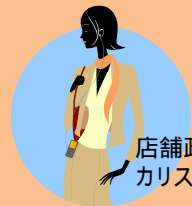
店舗政策もこなせる カリスマパーソナルスタイリストに

ファッションの 基本知識 ・トレンド情報・服飾史・採寸技術 ・バランス+色のコーディネート力100% ・部下の育成指導能力/リーダーカ