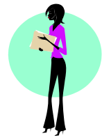
平均的な販売員 B子さんが

カウンセリング能力 お客様の要望は 聞くものの、お客 様を100%満足 させることが出 来ない